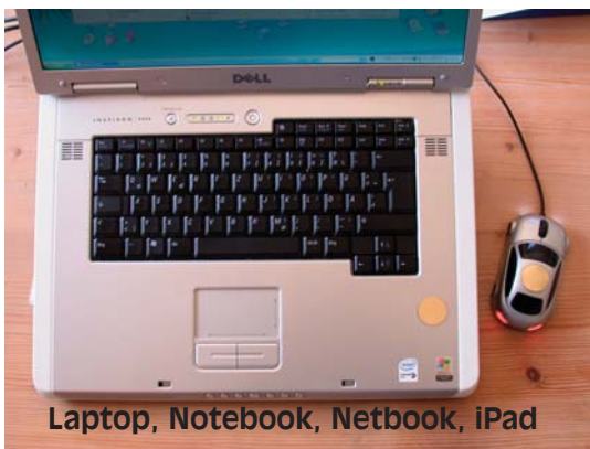
Laptop, Notebook, Netbook, iPad