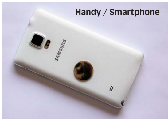
Handy / Smartphone