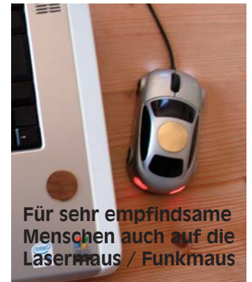
Für sehr empfindsame Menschen auch auf die Lasermaus / Funkmaus

Auch zu verwenden bei PC, Heizdecke, im Auto, Bildschirme, Fernseher, Sprechfunk usw.